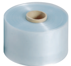
スプリングチューブ 0.06×80×100m巻