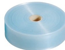
ハウス押さえベルト 0.15×60×100m巻